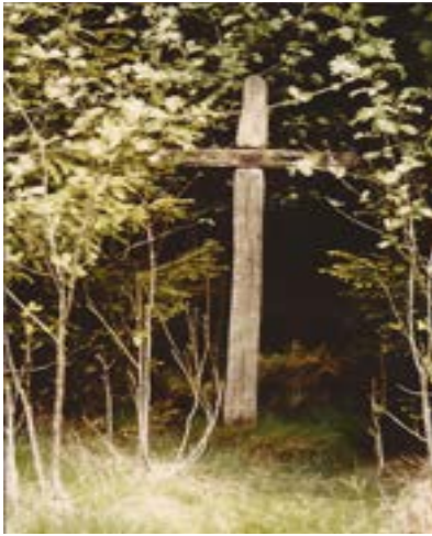
Aufnahme von 1991