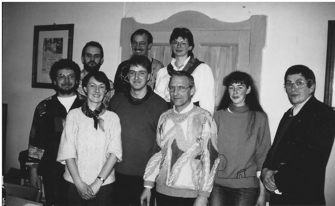
Der neue Vorstand vom 17.02.1991