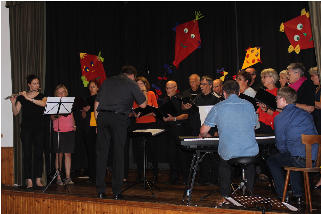
Die Chorgemeinschaft „Friede“ feierte im Jahre 2019 ihr 90-jähriges Bestehen.