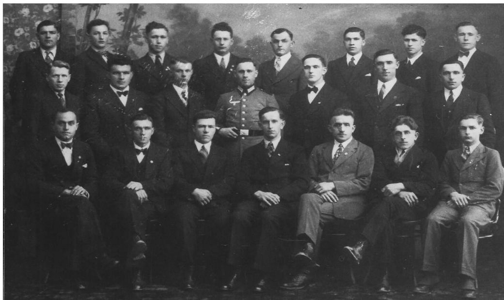
MGV „Friede“ im Oktober 1937

In den Folgejahren erlebte der Verein eine Blütezeit: Sängerabende, Theateraufführungen und Tanzveranstaltungen belebten das Dorfgeschehen. Bis zum Ausbruch des zweiten Weltkrieges war die aktive Mitgliederzahl auf rund 40 Sänger angestiegen.