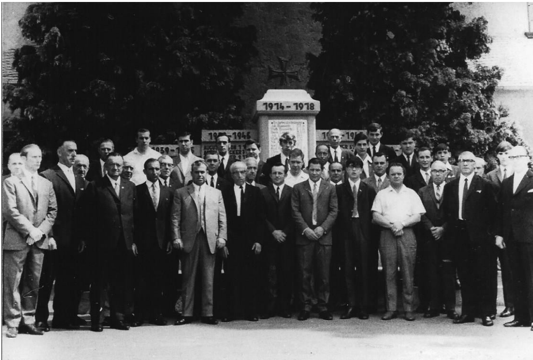
Die Aufnahme zum 40-jährigen Jubiläum entstand am 21. Juni 1970 nach dem festlichen Hochamt und der anschließenden Totenehrung am Ehrenmal