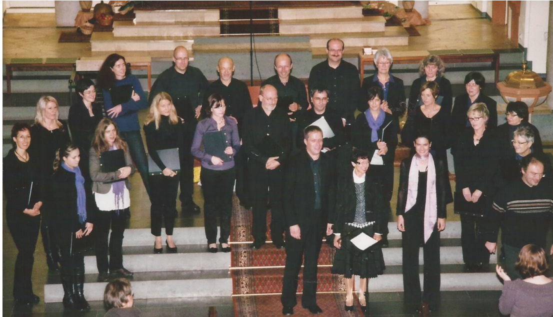
Viele schöne Konzertabende wie die Aufnahme vom 02.10.2006 zeigt, bereicherten das kulturelle Leben in unserer Gemeinde.