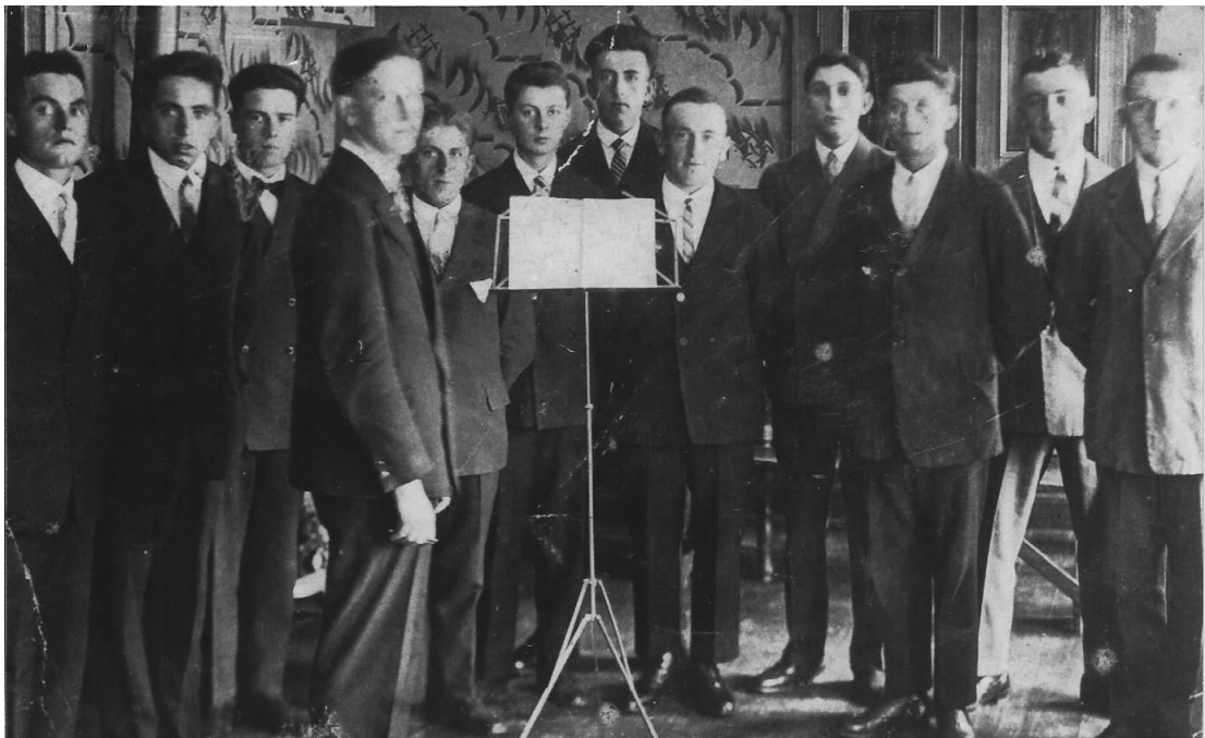
Aufnahme aus dem Jahre 1931 im Vereinslokal Nellinger

Dieser anfangs kleinen Schar ist es zu verdanken, dass die Sangesfreudigkeit in unserem Dorfe geweckt und die Zahl der Mitglieder innerhalb kurzer Zeit auf 30 angestiegen war. Die erste öffentliche Veranstaltung war ein Ausflug ins benachbarte Saarland, nach Dagstuhl und über Sitzerath wieder zurück. Bei der Einweihung der „Ölbergkapelle“ in Sauscheid im Gründungsjahr, sang der junge Verein das Lied von Konradin Kreuzer „Die Kapelle“, und ein Familienabend an Weihnachten 1929, waren die ersten zaghafte Aktivitäten. Bei einem Sängerwettbewerb am Sonntag, dem 22. Juni 1930 in Alsweiler belegten die Gusenburger den dritten Platz. Das erste Konzert und Sängerabend fand am zweiten Weihnachtstag 1930 großen Anklang.